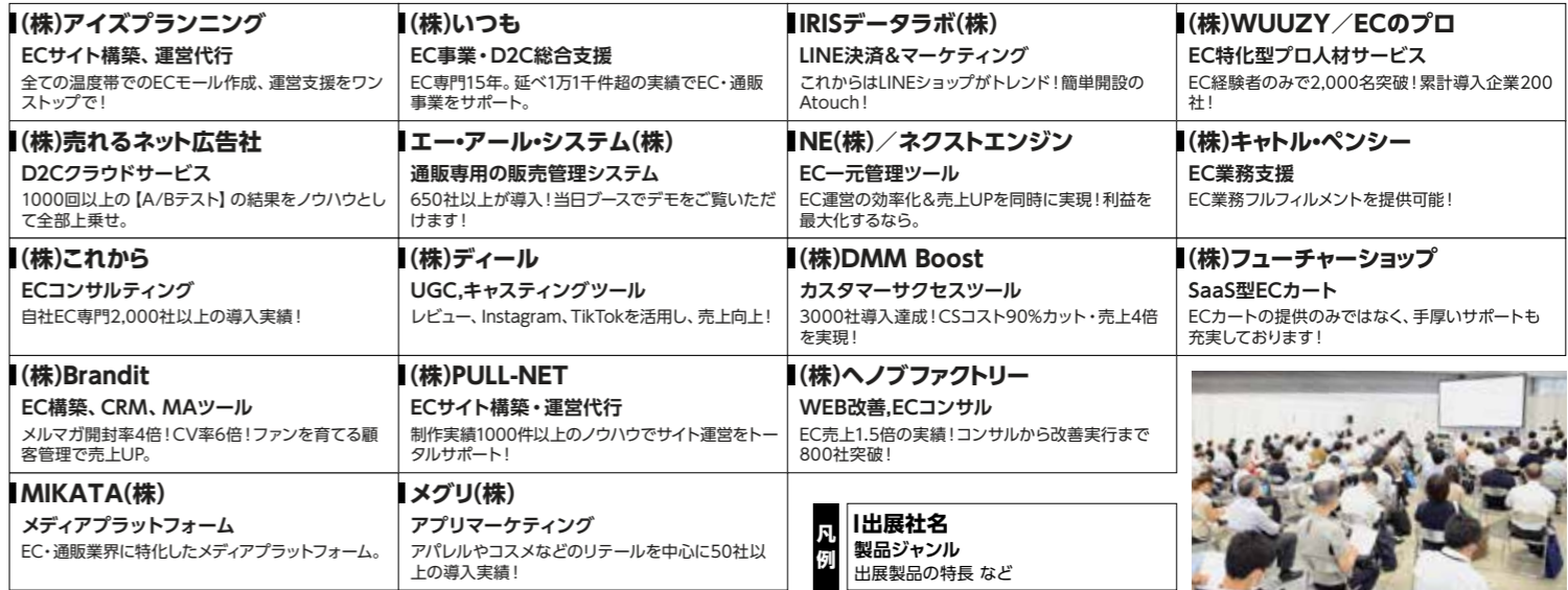
*写真は、東京展(2022年8月開催)の様子です。